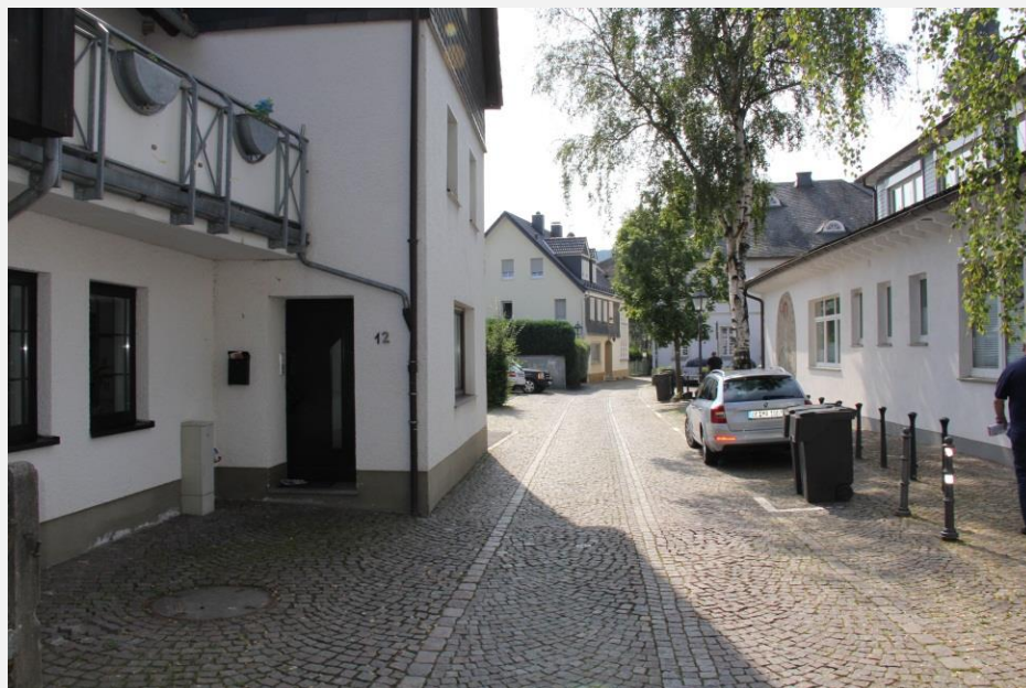
starker Anteil an Parksuchverkehr