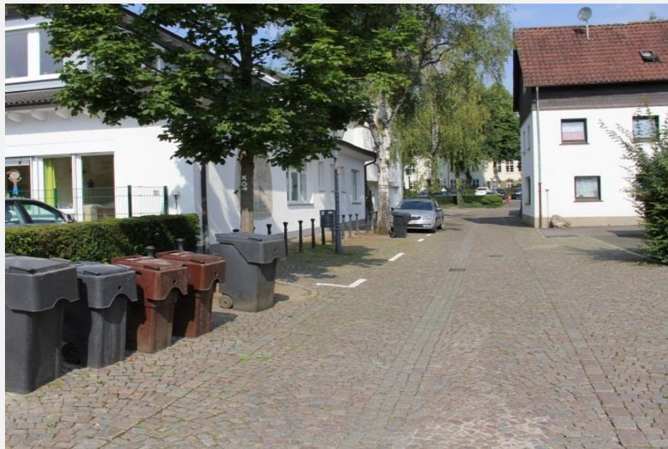
hohes Verkehrsaufkommen (belastet sensible Einrichtungen, z.B. Kindergarten)