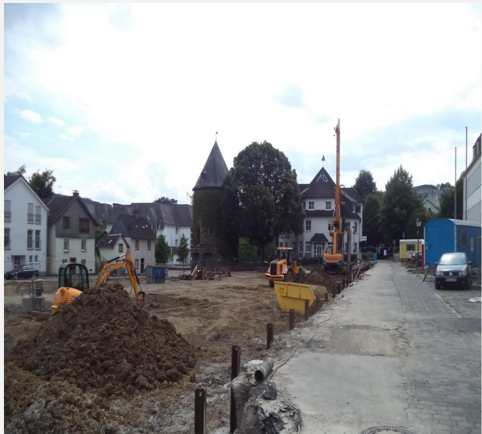
Umbaumaßnahme Parkdeck „Feuerteich“. Der Westwall wird in diesem Zusammenhang neu gestaltet