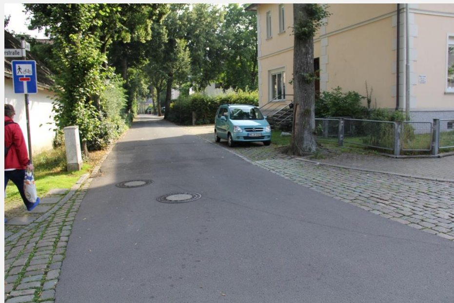
Walling an den Altstadteingängen schwer ablesbar