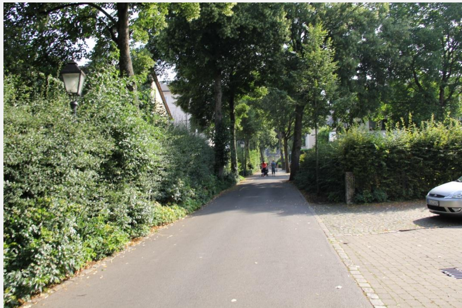
Oberflächenbeschaffenheit und Stadtmobiliar z.T. unpassend