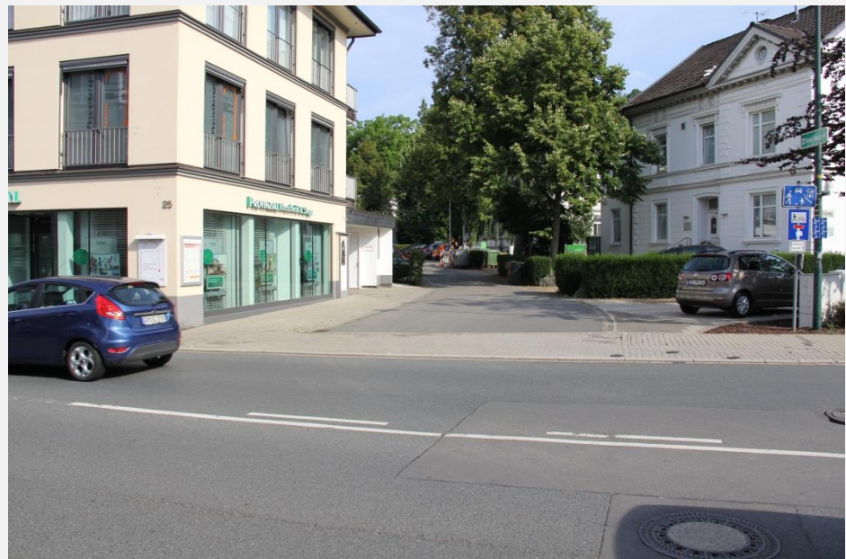
Wallring an den Altstadteingängen schwer ablesbar