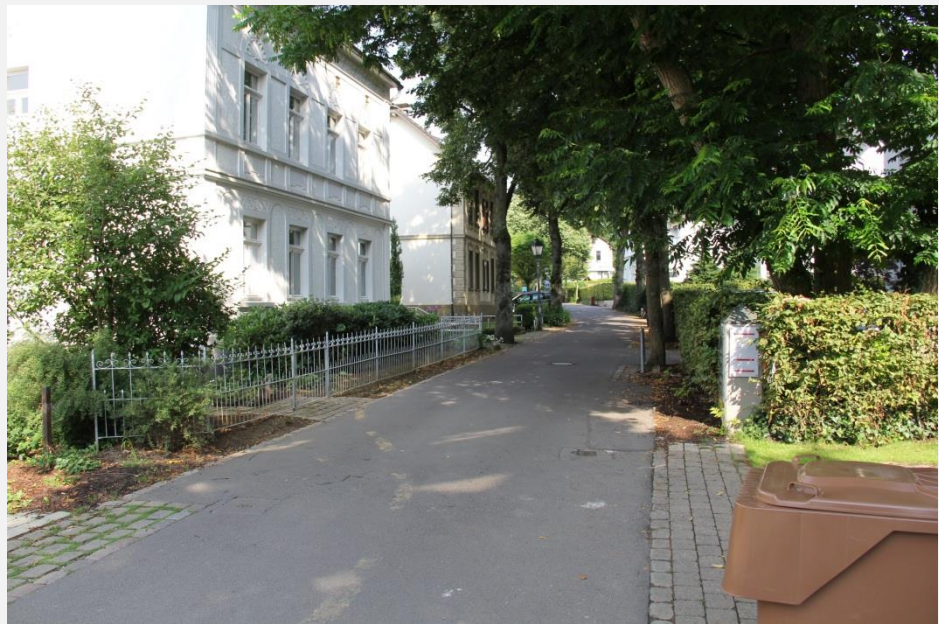
Oberflächenbeschaffenheit und Stadtmobiliar z.T. unpassend