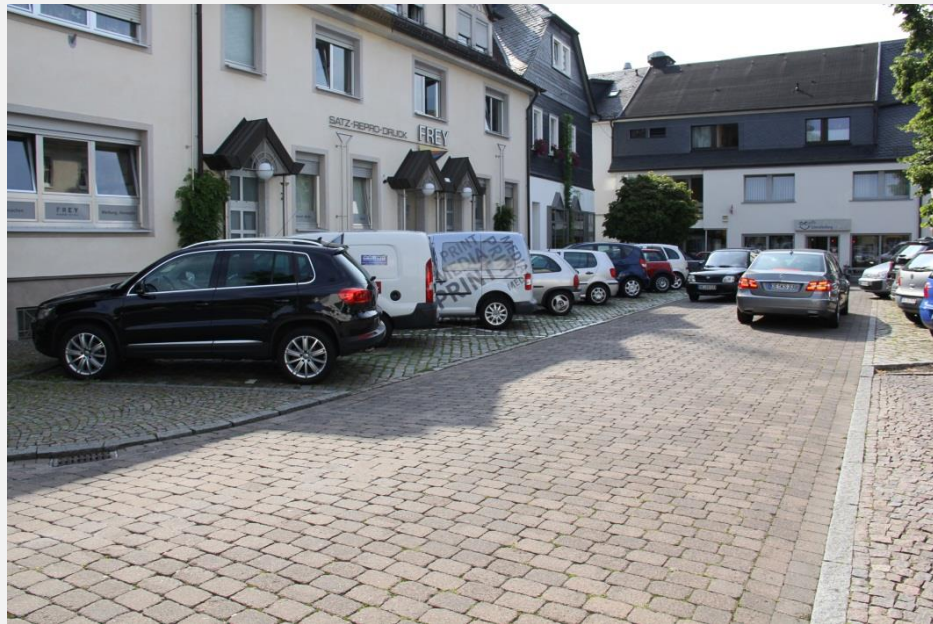
Unsichere Verkehrssituation für Fußgänger durch starken Parksuchverkehr