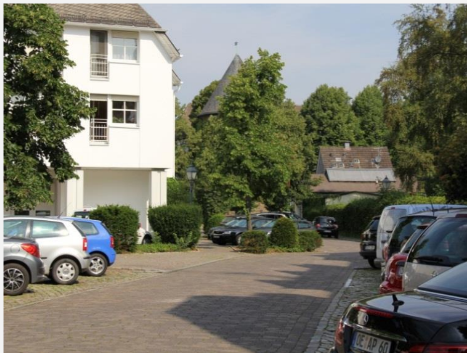
Schwierige Orientierung und Mängel in der Qualität der Fußwegebeziehung