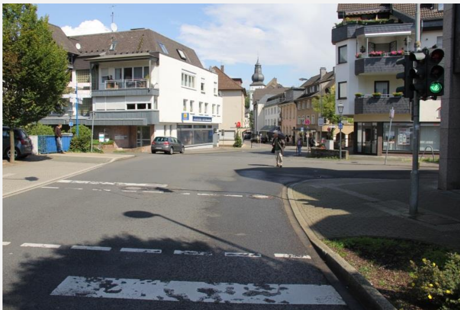
Altstadteingang mit Wallring schwer ablesbar